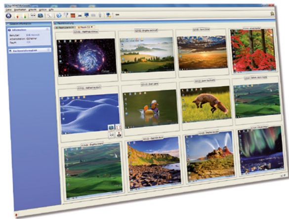
Bildschirmübertragung und -steuerung mit der IdConsole.

Über die pädagogische Oberfläche hinaus bietet logoDIDACT Grundfunktionen für das digitale Lernen. Die Benutzerverwaltung ist in logoDIDACT einheitlich in einer zentralen LDAP-Datenbank konzentriert, so dass keine separaten Benutzer in „Moodle“ oder anderen Anwendungen gepflegt werden müssen. Eine Anbindung an eine andere externe Lernplattform ist problemlos möglich.